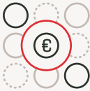
RECHERCHE DE FINANCEMENT