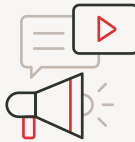
COMMUNICATION ET MARKETING