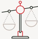
JURIDIQUE ET REGLEMENTAIRE