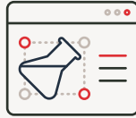
COLLABORATION AVEC LA RECHERCHE